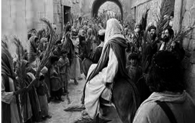
ကစၢ်တဂၤအံၤမုာ်ကစၢ်အစီၤစီၤအဃုာ်ဃုာ်လီၤ. အဝဲ ဒဲၣ်န့ၣ်ကဆုၢ်ပုၤတုၤပသံလီၤ.

ကစၢ်ခရံၣ်အတံာ်ဟ့ၣ်လီၤအကလုာ်အံၤ မုာ်တံာ် လၢတံာ်စံးဟံၤအိၣ်တုာ်ဝဲအဃိလီၤ. ကစၢ်ယုၤအိၣ်ဒီးအ ကျဲလၢကကတံာ်ကတိၤပာ်ဝဲအသိး ပုၤလၢတံာ်အဲၣ်အိၣ် ပဝဲဒဲၣ်အံၤ ကစၢ်ယုၤကတံာ်ကတိၤပာ်ကျဲလၢပဂီၢ်အ ဂုၤကတံာ်န့ၣ်လီၤ. မုာ်နံၤခံကတံာ်ပကအိၣ်ဘၣ်လၢ တံာ် လီၢ်လၢအမုာ်အဂီၢ် အဝဲကတံာ်ကတိၤဝဲန့ၣ် မုာ်တံာ်နီၣ်နီၣ် လၢပသမၤအလီၢ်တအိၣ်ဘၣ်န့ၣ်လီၤ. ဒ်န့ၣ်အသိးလၢ ပတံာ်အိၣ်မူလၢဟီၣ်ခိၣ်ချၢအံၤဒဲၣ်လဲာ် ကတံာ်ကတိၤ ဃာ်တံာ်လၢပဂီၢ်န့ၣ် ပဘၣ်န့ၣ်အိၣ်န့ၣ်လီၤ. (စံး ၄၈:၁၃)